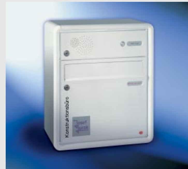
Abb. 53/2 Kastenformat 370 x 330 x 145 mm, mit RS50 und RS4, ALU-Verkleidungsprofil RS 2000.