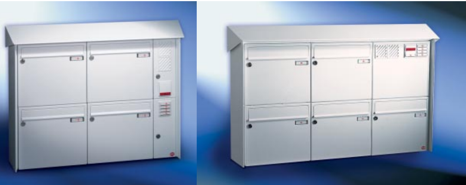
Abb. 52/1 Kastenformat 370 x 330 x 100 mm, PRISMA®-Verkleidung.

Anlagen mit senkrechten Briefkästen. Aufputz.