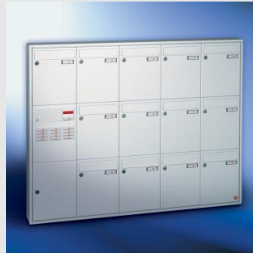
Abb. 51/1 Kastenformat 260 x 330 x 100 mm, ALU-Verkleidungsprofil QUADRA® 4-seitig.