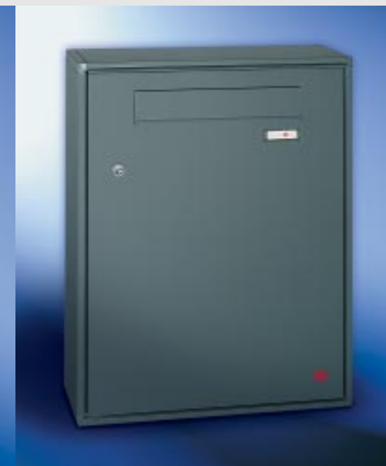
Abb. 51/4 Schwere Baureihe, Kastenformat 520 x 660 x 145 mm, 2-Punkt-Verriegelung. ALU-Verkleidungsprofil QUADRA® 4-seitig.