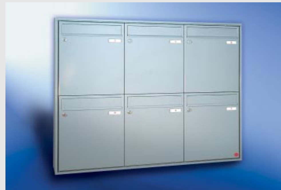
Abb. 51/3 Kastenformat 370 x 440 x 145 mm. ALU-Verkleidungsprofil QUADRA® 4-seitig.