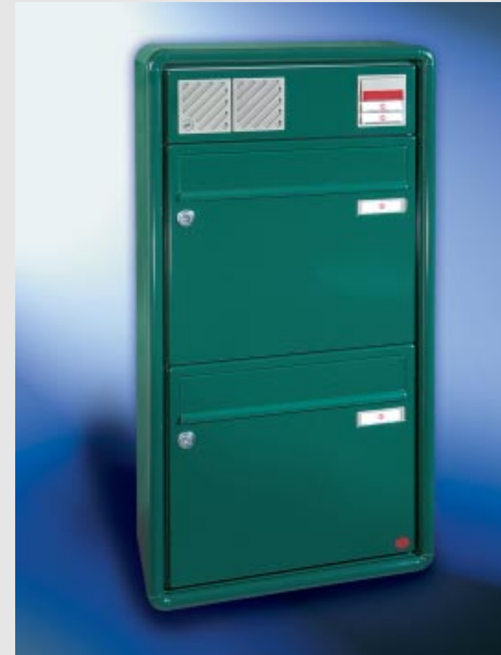
Abb. 53/1 Kastenformat 370 x 330 x 145 mm, mit RS50, ALU-Verkleidungsprofil RS 2000.