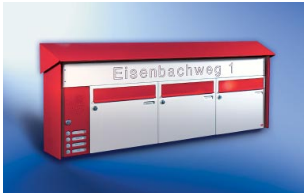
Abb. 52/3 Kastenformat 370 x 330 x 145 mm, mit RS50 und RS4, Beschriftungskasten, PRISMA®-Verkleidung.